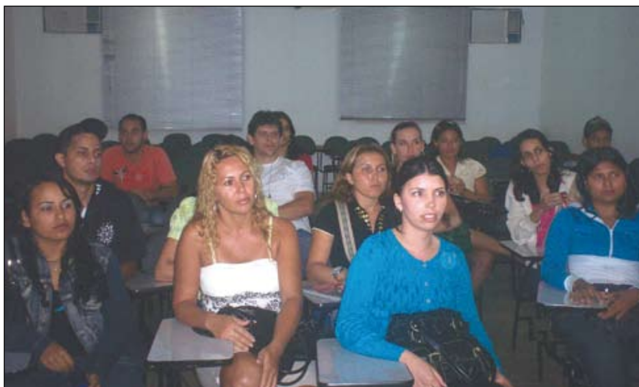
Funcionários da Fortium se reúnem com diretores do SAEP para discutir problemas relacionados às demissões

Como se não bastasse o fim do emprego para inúmeros traba-