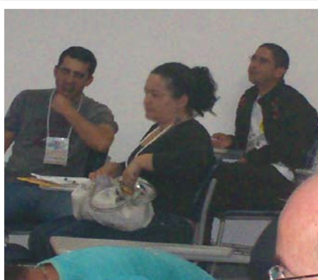
Representantes do SAEP presentes no encontro nacional dos sindicatos de auxiliares de administração escolar